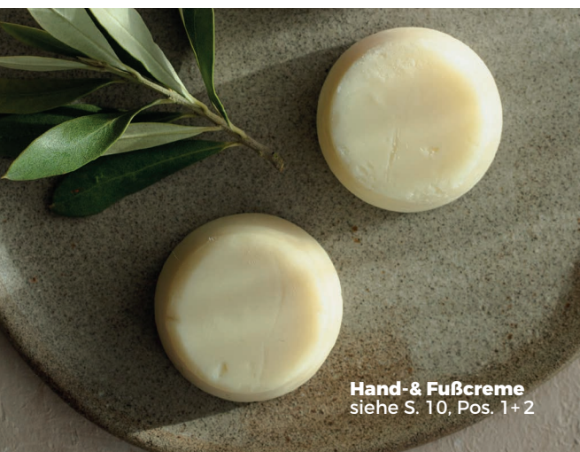
Hand- & Fußcreme siehe S. 10, Pos. 1+2